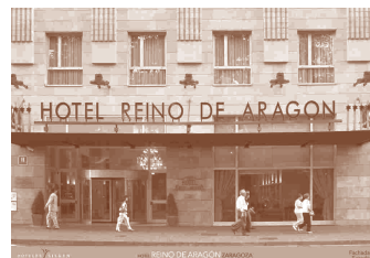
Hotel Silken Reino de Aragón**** Coso 80 50001 Zaragoza. Aragón

Localización: A 10 minutos del Hotel Palafox