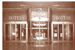
Hotel Boston***** Avda. de las Torres, 28 50008 Zaragoza. Aragón

Localización: A 15 minutos del Hotel Palafox