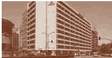
Hotel Melia Zaragoza***** Cesar Augusto 13 50004 Zaragoza.Aragón