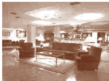
Hotel Goya**** Cinco de Marzo, 5 50004 Zaragoza. Aragón

Localización: A 5 minutos del Hotel Palafox